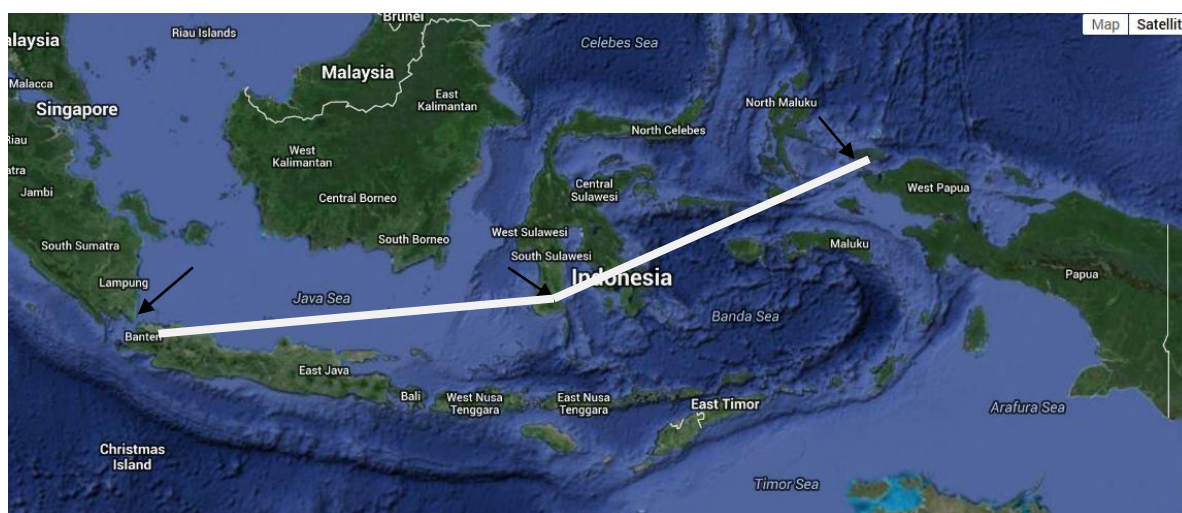
Figuur 1: route Jakarta-Makkassar-Sorong