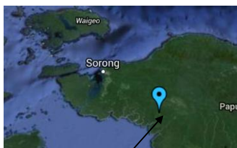
Figuur 2 Teminabuan

De eerste nacht aan boord geslapen en de volgende ochtend met een paar 4WD's naar Teminabuan, dat is 160 km, maar wel 7 uur rijden over erbarmelijke wegen. In Teminabuan overnachten we in een school, een meisjes internaat dat vooral door Nederlands sponsorgeld in stand wordt gehouden.