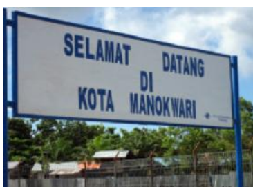
Figuur 3 Welkom in Manokwari

Ook hier veel Indonesische inwoners en weinig Papoea's, streng moslim, dus geen bier. (Aan boord kunnen we dit wel kopen.) De volgende dag bezoeken we de kazerne, goed herkenbaar zijn de Nederlandse gebouwen. (Dit is trouwens de enige kazerne die we hebben mogen bezoeken, op alle andere plaatsen, Sorong, Manokwari en Biak werd de toegang geweigerd.)