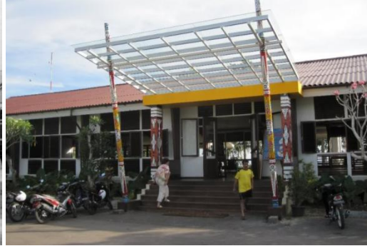
Figuur 5 Huidige( KLM )hotel

Op 14 april vertrekken we weer uit NNG en vliegen via Ujung Pandang naar Jakarta waar we nog 8 uur moeten wachten voor we in het vliegtuig naar Amsterdam gaan.