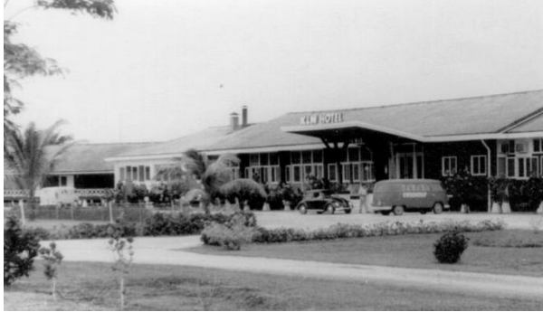
Figuur 4 Oude KLM hotel

(Wil je op een veteranenreis kazernes bezoeken dan zal dat via de ambassades in Den Haag en Jakarta van te voren geregeld moeten worden, plaatselijk lukt dat niet.)