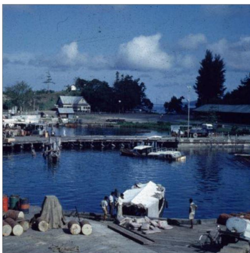
Figuur 3 Sorong haven 1961

Op 6 april zijn we terug in Sorong, we bezoeken eerst nog het eiland Jefman (vroeger een vliegveld, maar de strip wordt niet meer gebruikt). Er zijn twee kampongs: een islamitische en de ander is christelijk.