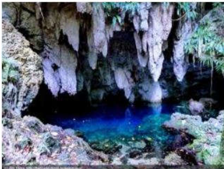
De blauwe grot Biak

Uiteraard is het erg leuk om een reactie te krijgen op je schrijfsel maar vooral als diegene dan ook nog betrokken was en ja, dat was meneer Doggenaar beslist en altijd met 'n portie humor. Zonder hem en de landingsdivisie was ik vermoedelijk nooit in de Blauwe grot geweest en net zomin in de Jappengrot waar wij als lid van de landingsdivisie ook een zijsprong naar mochten maken. Blijkbaar zat het OS&O hem in het bloed.