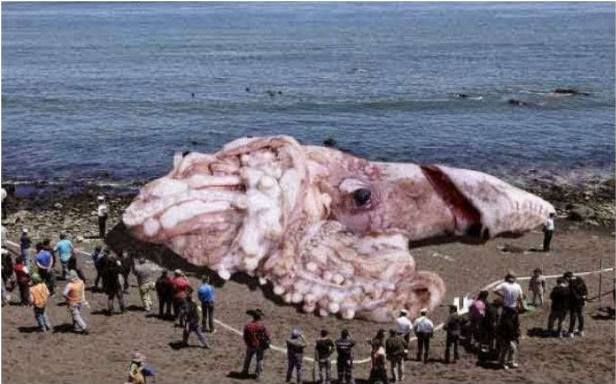
Zowel de inktvis als de paling werden in de Radjah Ampat gevangen.

Wij hebben er ook lekker rondgezwommen zonder teveel onder water te kijken en dat is misschien maar goed ook gezien de volgende foto's.