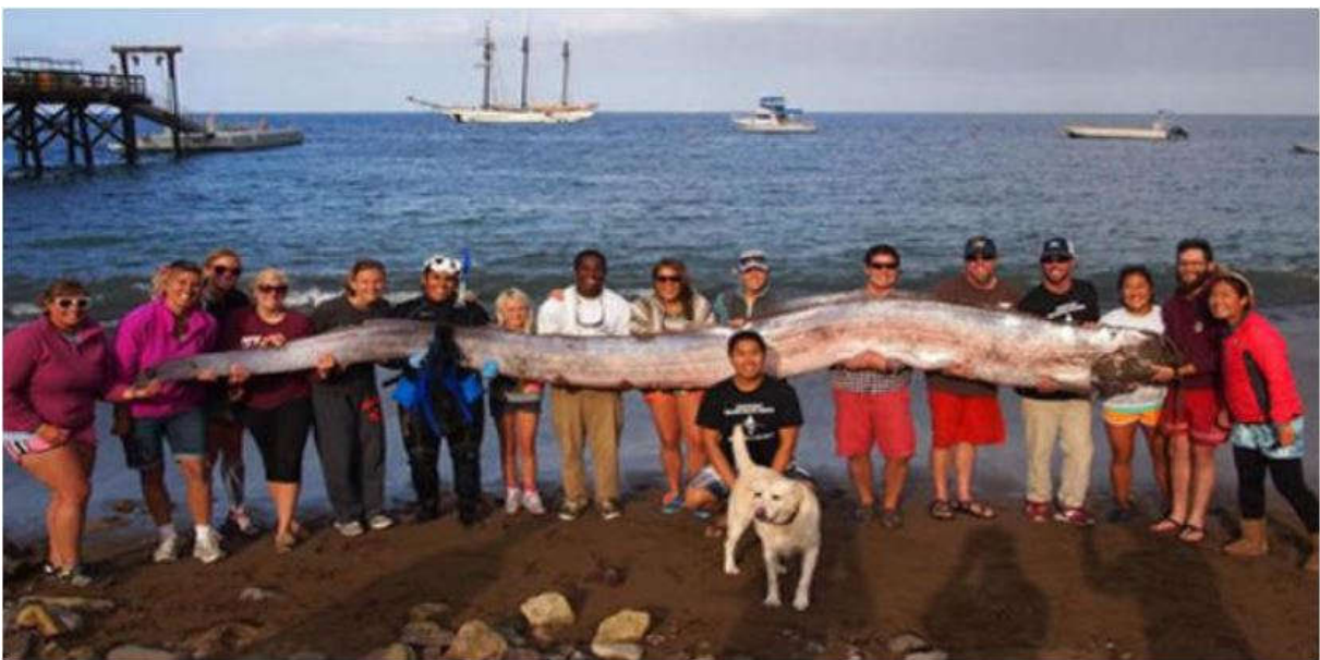
Maar ook boven water hebben wij zo'n diversiteit nooit gezien.....