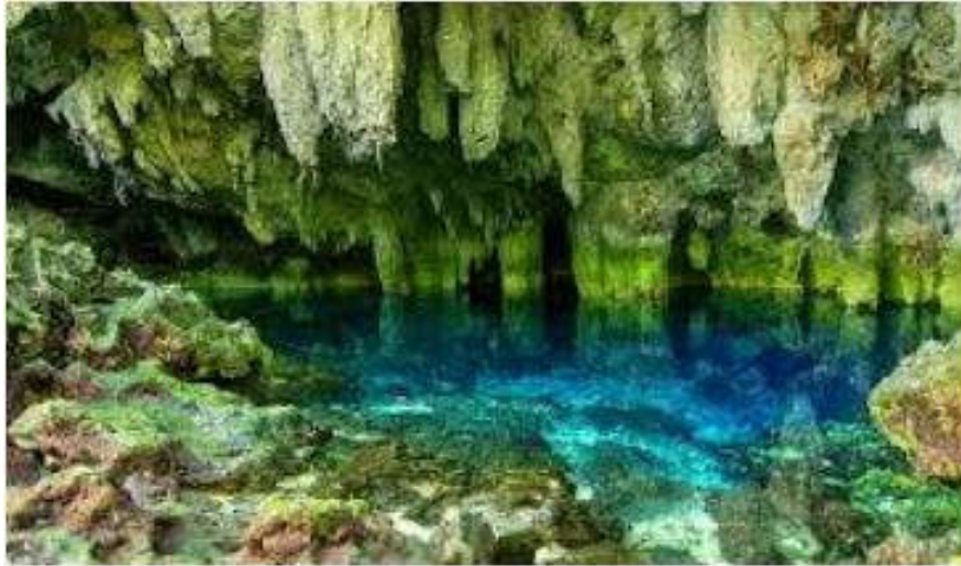
De Blauwe grot in Biak