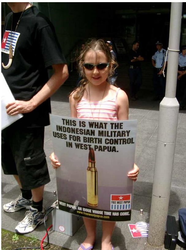
Bijgaande foto hoeft geen commentaar.....

Hieronder nog een link naar een artikel over Vlakke Hoek. Vooral de commentaren zijn veelzeggend... ( Ctrl en links klikken op te openen )