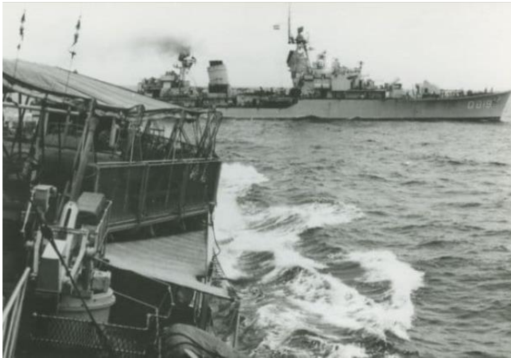
Foto van de Piet Hein en de Amsterdam.

Voor de liefhebbers vond ik ook nog advertenties van enkele fraaie nautische horloges: