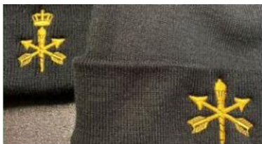
machinisten embleem zonder kroon is ook verkrijgbaar in het rood

https://www.debakstafel.nl/marine-mutsen.html