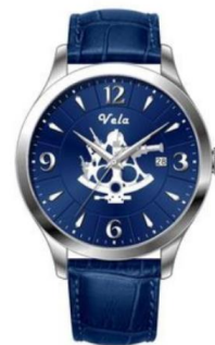
VELA-WATCH SEXTANT BLUE VW300