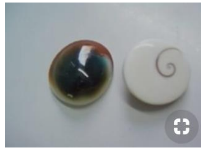
Mata Biak, zoals wij hem kennen maar elders genoemd: Eye of St. Lucia